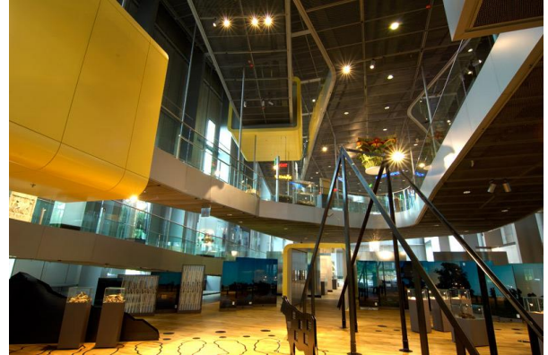
Het museum van binnen; je loopt ongemerkt door de tijd rond en omhoog