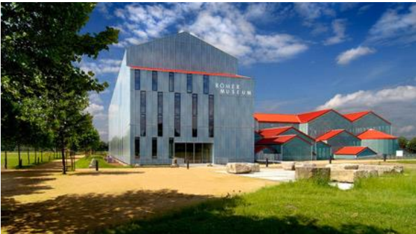
Buitenkant van het prachtige Römermuseum in Xanten (met op de achtergrond de typisch Romeinse daken van het badhuis)